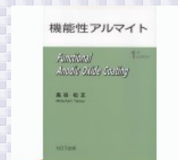
好評シリーズが 単行本化！